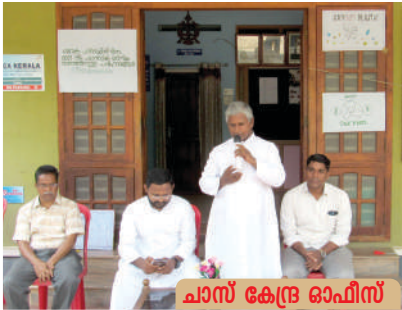
ചാസ് കേന്ദ്ര ഓഫീസ്