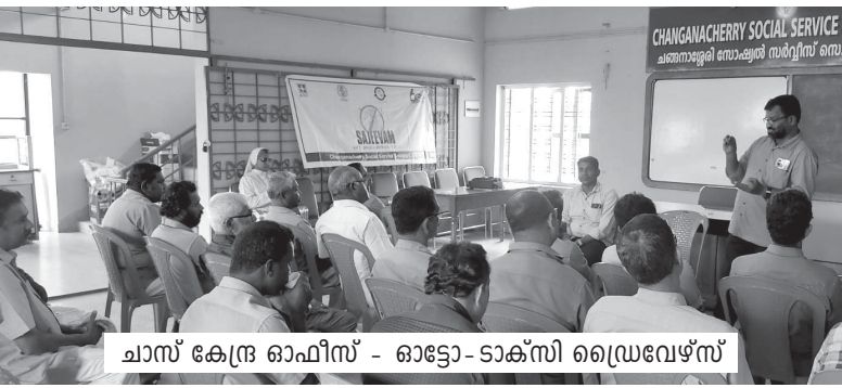
ചാസ് കേന്ദ്ര ഓഫീസ് - ഓട്ടോ-ടാക്സി ഡ്രൈവേഴ്സ്