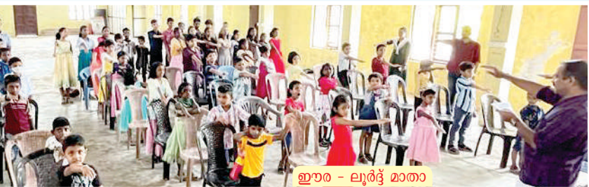
ഇര - ലൂർദ്ദ് മാതാ