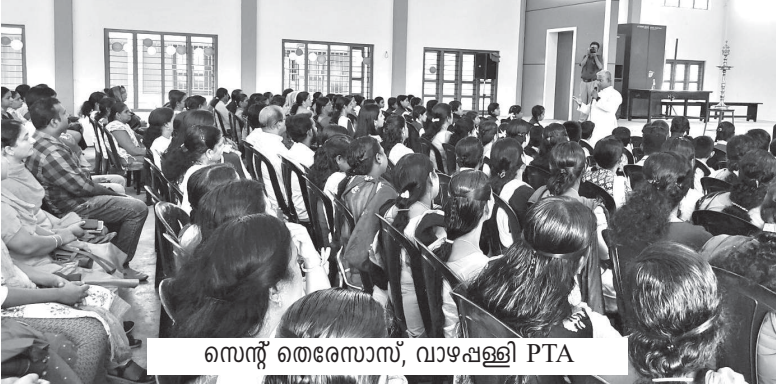
സെന്റ് തെരേസാസ്, വാഴപ്പള്ളി PTA